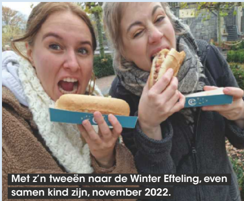
Met z'n tweeën naar de Winter Effeling, even samen kind zijn, november 2022.

‘Toen ik in het ziekenhuis lag, fleurde Lotus mijn kamer op met paastakken, zo lief’