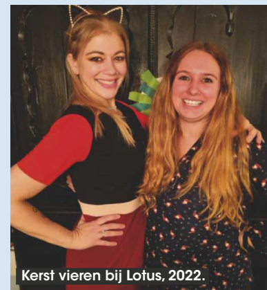
Kerst vieren bij Lotus, 2022.

Dan spreken we allemaal lange voiceberichten voor elkaar in die we tijdens het wandelen afluisteren.”